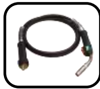
تورچ هواخنک Air cooled Torch