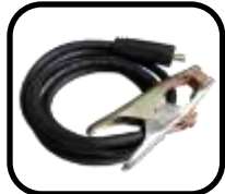
کابل جوشکاری با گیره اتصال به قطعه کار Welding cable including earth clamp