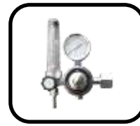
رگولا تورو هیتر گاز Regulator and gas heater