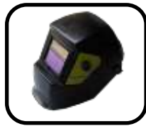
ماسک الکترونیک Electronic mask